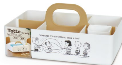
パッケージイメージ