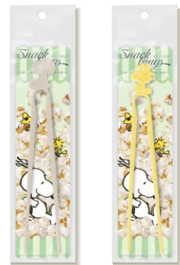
パッケージイメージ

© 2025 Peanuts Worldwide LLC PEANUTS™ 日本のスヌービーの公式サイトは www.snoopy.co.jp ※ イメージに使われております小物は商品に含まれておりません。